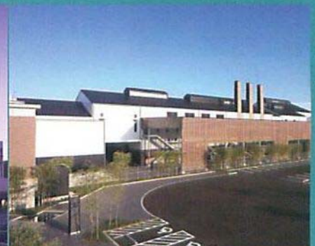
祝賀会会場: 霧島ファクトリーガーデン