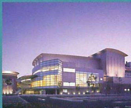
式典及び記念事業会場: 都城市総合文化ホールMJ